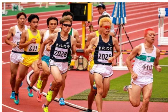
▲男子 800m 決勝

落ち着いたスタートをするがブレイク後に度々接触し、200mを最後尾で通過。その後外からポジションを上げ、400mを58"台の3番手で通過。その後ペースが上がる中で加速し、残り200m手前で先頭に立つ。最後の直線で1人にかわされるも、2着で決勝に進出した。